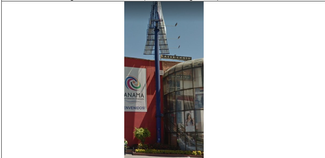
Foto 2. Detalle del mástil y de la estructura tubular en buenas condiciones y estable, ubicada en la Diagonal 182 No. 20-91 (dirección Registrada) orientación Sur-Norte .